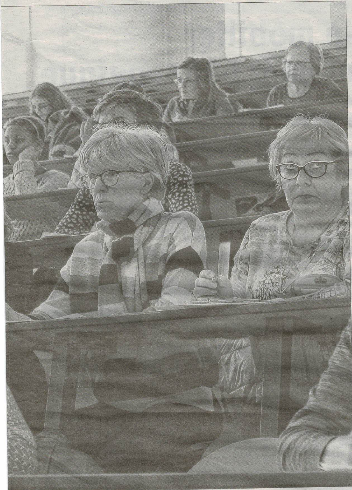
Une cinquantaine de personnes ont planché sur un texte truffé de pièges.