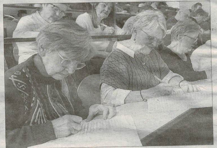
Les adultes avaient le choix de s'arrêter au texte « amateurs » ou de prolonger par le paragraphe ouvert aux « professionnels. »